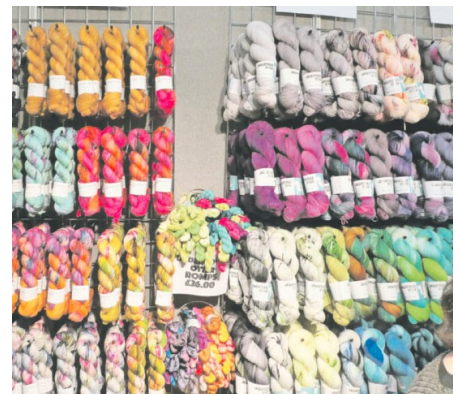
Bunt. Die Weberin besuchte das Edinburgh Yarn Festival.